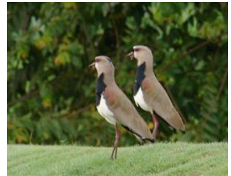
Pareja de Caravanas en la cancha de golf.

El inventario inicial incluye especies de tamaños grandes y que los golfistas ven fácilmente, como los cormoranes y cuatro especies de garzas que frecuentan los lagos, muchas loras cabeciazules y las caravanas que defienden ruidosamente sus nidos y pichones. Muchas especies de tamaños menores se ven en los árboles y cafetales vecinos, como azulejos, cucaracheros, tángaras, siriríes, tres especies de colibríes, cuatro tórtolas y cuatro carpinteros diferentes. Algunas especies