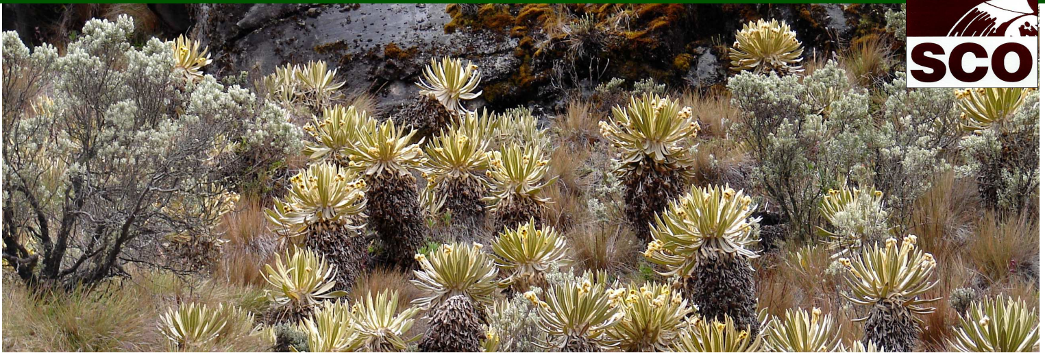
Paisaje de páramo con frailejones.