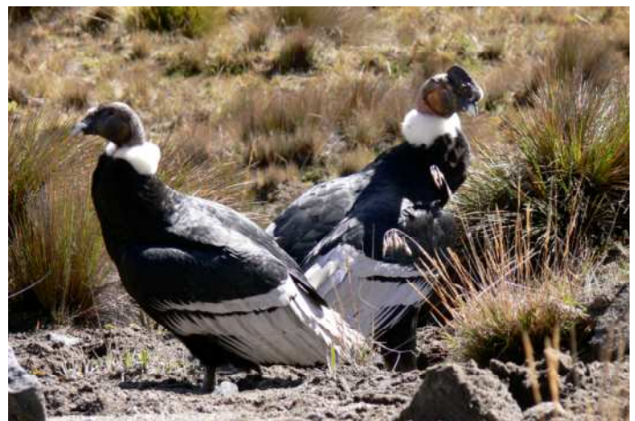
Pareja de Cóndores en el PNN Nevados.

Fumsol fue creada en el 2004, con el objetivo de contribuir a la conservación del Cóndor Andino. Ha realizado programas de educación ambiental con las comunidades aledañas al Parque. Además participó