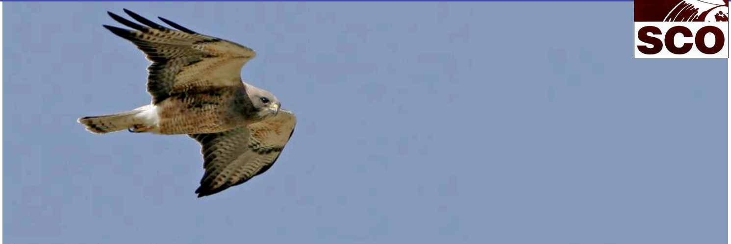
Gavilán de Swainson planeando.