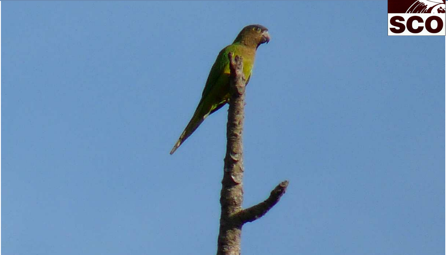
Cotorra Carisucia.