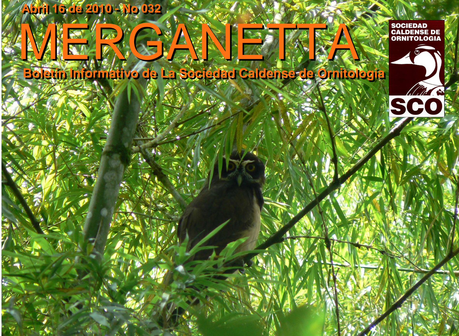
Búho de Anteojos en El Alto del Naranjo.