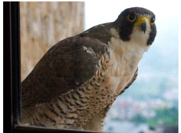
Halcón Peregrino en el edificio de la Alcaldía de Manizales

E l pasado domingo 24 de abril, un Halcón Peregrino fue observado en el edificio de la Alcaldía de Manizales, o lo que antiguamente se llamó, edificio del Banco Cafetero. Parecería que es el mismo individuo que el año pasado estuvo allí por varios meses y con el cual se familiarizaron las personas que viven en los apartamentos de la parte alta del edificio.