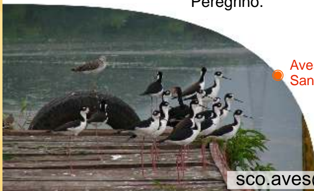
Aves acuáticas en el Embalse San Francisco