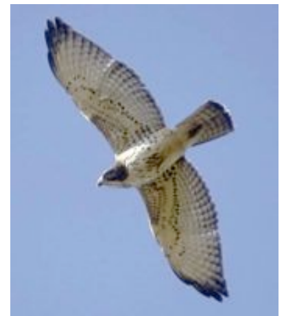
Gavilán Aliancho ( Buteo platypterus ), una de las especies migratorias