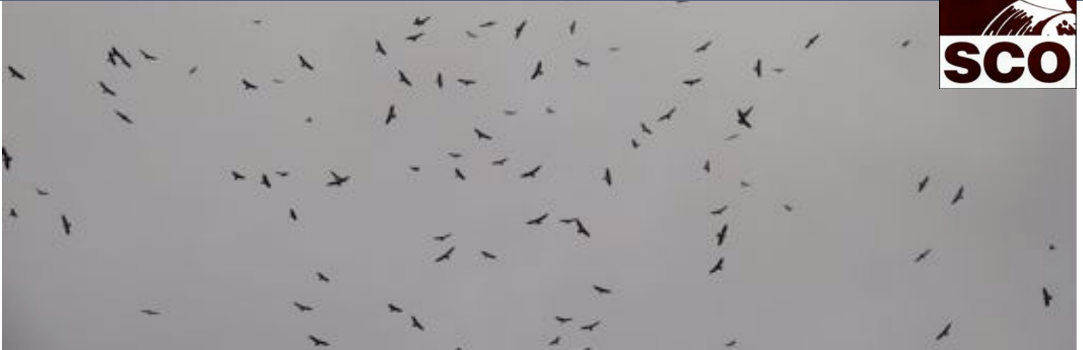
Porción de un enorme remolino de gavilanes sobre San Francisco (Cundinamarca) el lunes 28 de octubre de 2008.