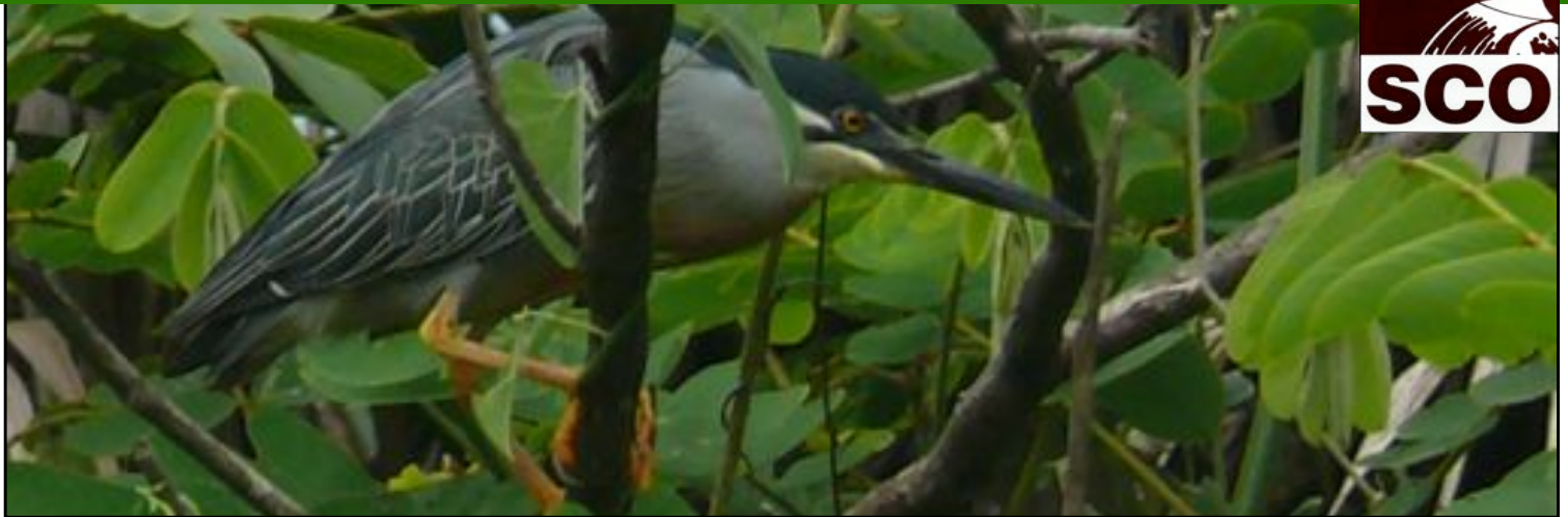
Garcita Rayada