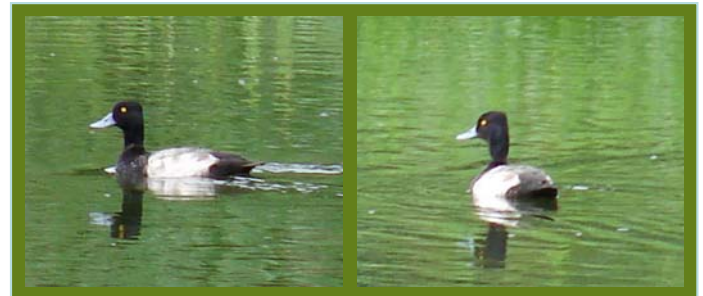
Fotos del Pato Canadiense macho en Cameguadua.

Esta especie de pato se alimenta de vegetación e invertebrados acuáticos que obtiene zambulléndose al fondo de los lagos y lagunas.