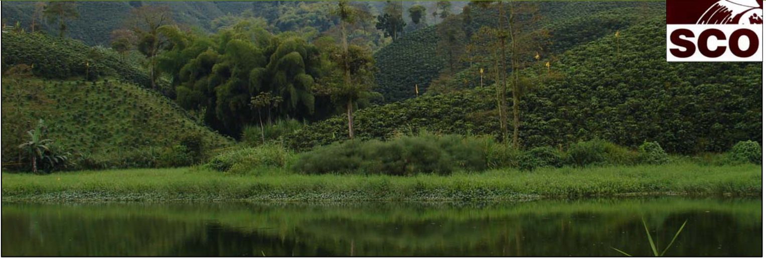
Represa Cameguadua en zona cafetera de Chinchiná.