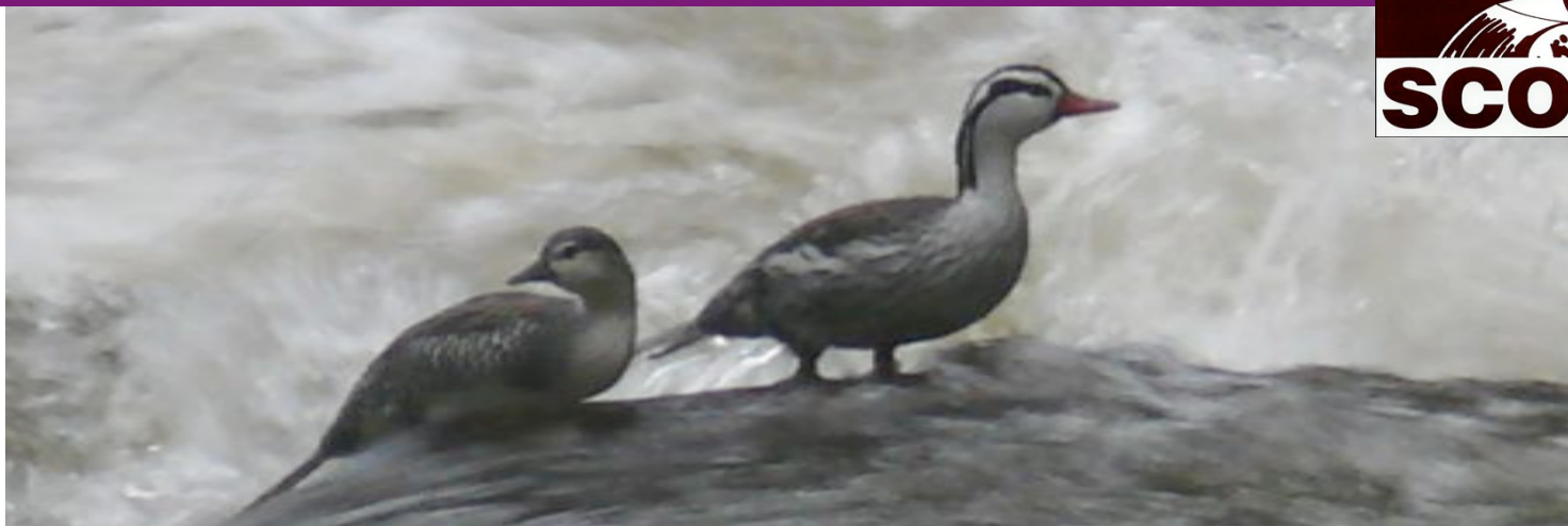
Juvenil y macho adulto en el Río Otún.