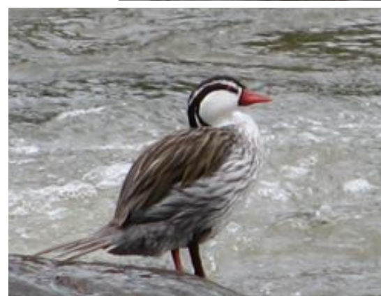
Hembra (arriba) y macho (abajo) en el río Quindío.