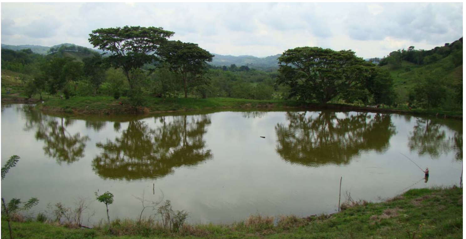
Uno de los jagüeyes o estanques que atraen aves acuáticas a la región.

Esta lista sigue la clasificación taxonómica del Comité Suramericano de Clasificación de la American Ornithologists' Union (versión enero 2009) , que difiere en algunos casos del usado por Hilty y Brown en el libro de las aves de Colombia.