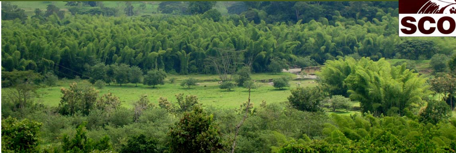
Paisaje ganadero con guaduales en los Planes de Neira.