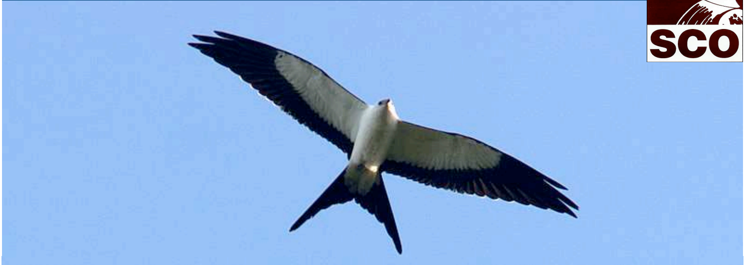
Aguililla Tijereta ( Elanoides forficatus ).