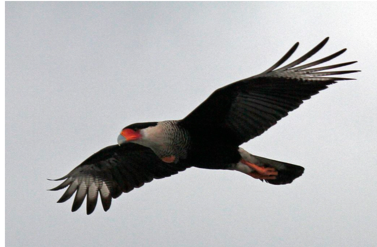
Caracara en el sector del Cable.

La presencia de esta pareja de Caracaras en el sector del Cable en Manizales ha despertado mucha curiosidad. La SCO ya ha recibido reportes de su presencia de más de cinco personas que residen o tienen oficinas en ese sector.