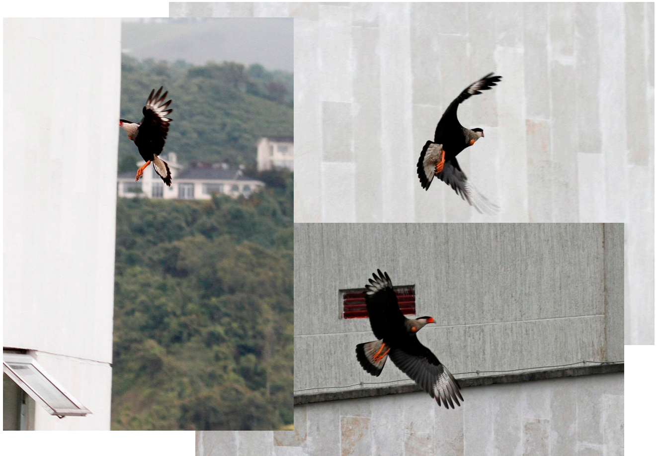
Caracara en el sector del Cable.

Algunos observadores han sugerido que la pareja puede estar anidando en alguno de esos edificios. Sin embargo, ese hecho aún no ha sido confirmado. Queremos invitar a los aficionados a las aves a que le hagan seguimiento a esta pareja de Caracaras y a que nos envíen sus observaciones.