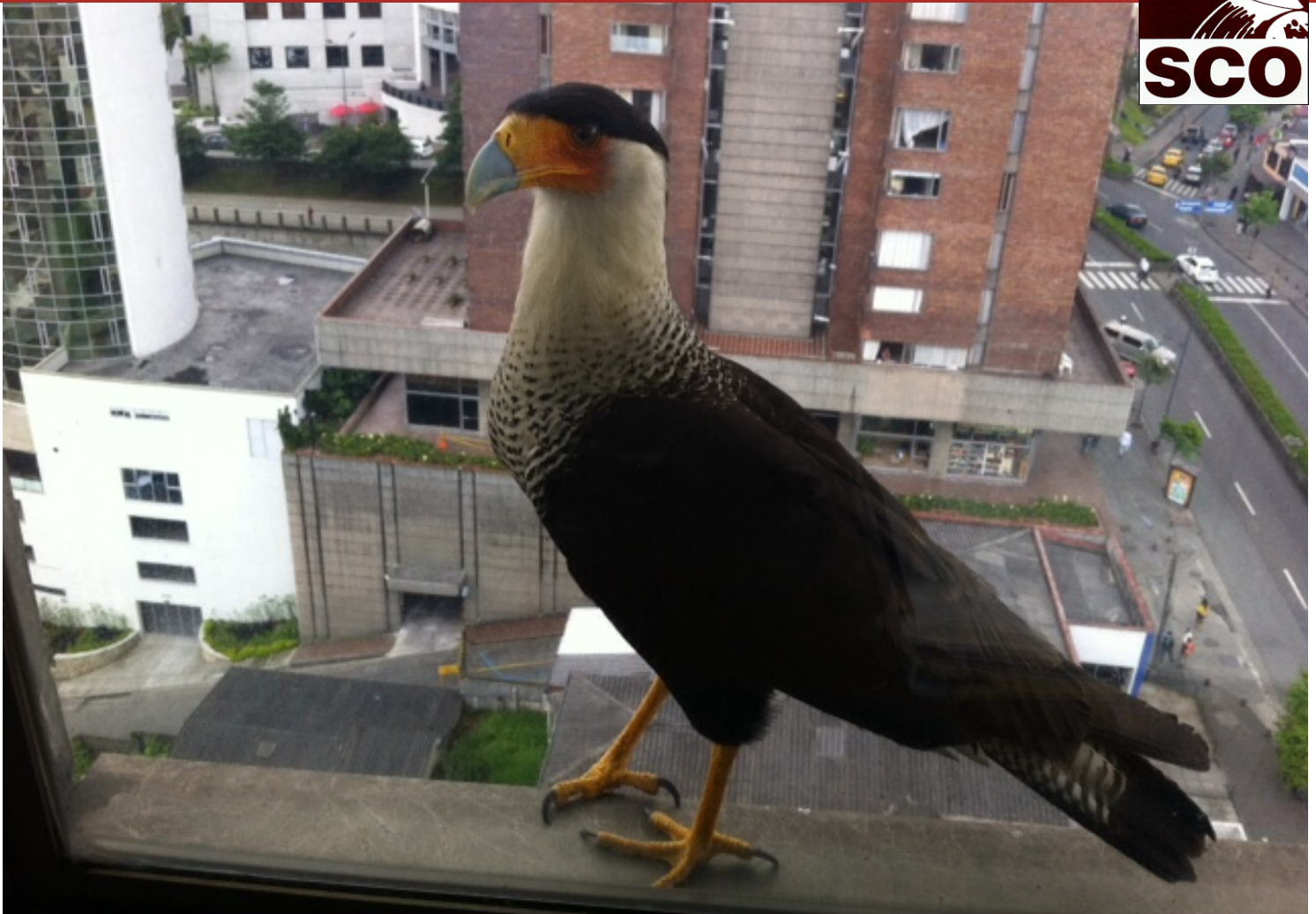
Caracara en el edificio El Castillo.